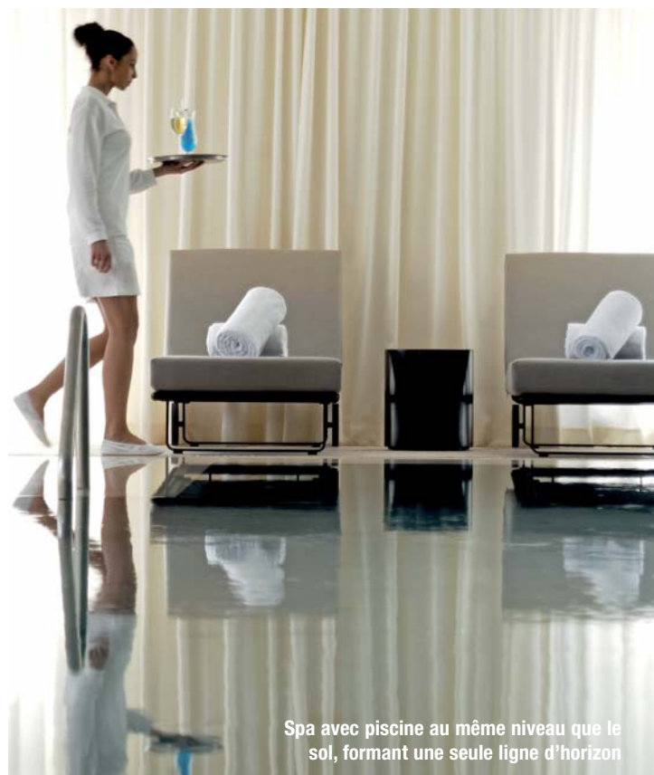
Spa avec piscine au même niveau que le sol, formant une seule ligne d'horizon

Le projet décoratif avec ses lignes épurées, des matériaux sobres et raffinés, des espaces bien différenciés respectent la fluidité et l'élégance de cet espace dans une harmonie minérale et végétale. Le jour ou le soir, en été comme en hiver, Odyssey se métamorphose sans cesse.