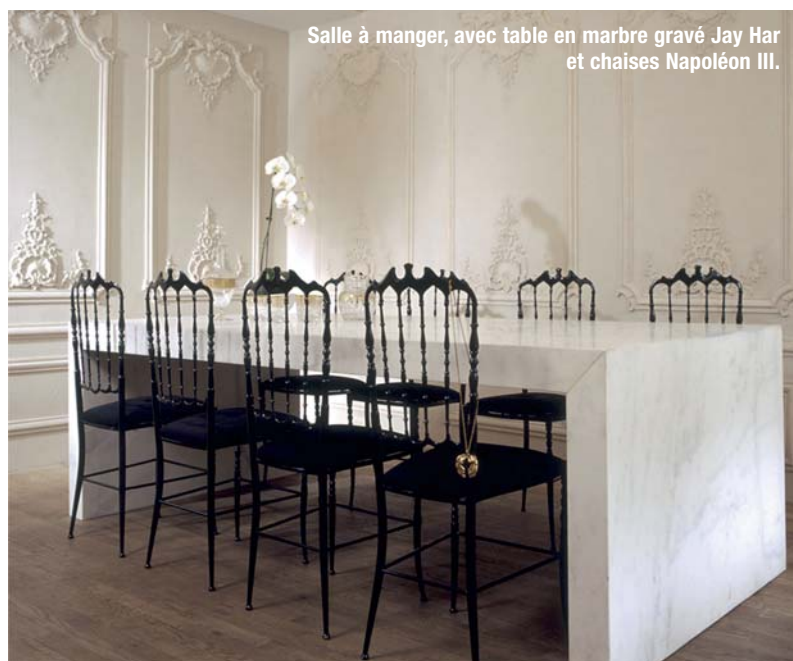
Salle à manger, avec table en marbre gravé Jay Har et chaises Napoléon III.

Le mobilier contemporain est fabriqué sur mesure tel que des bancs en marbre statuaire adouci blanc ou un canapé dans un velours capitonné marron glacé, ou encore des rideaux en laine de soie. La cuisine ultra sobre et moderne est une « arty kichen » en quelque sorte, où des pièces d'art contemporain ont pris place sur des étagères laquées blanches.