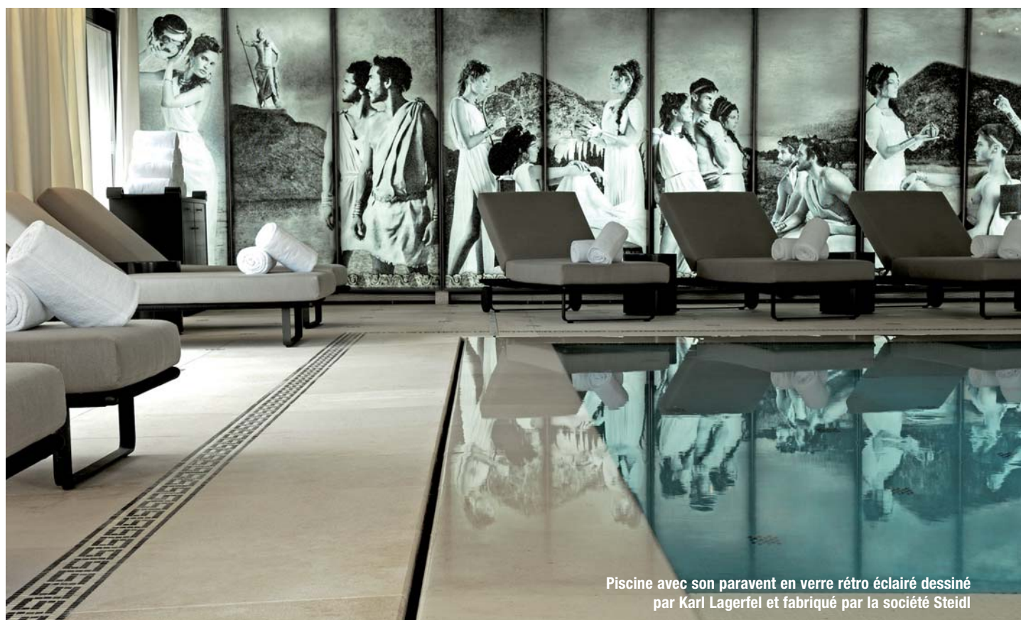
Piscine avec son paravent en verre rétro éclairé dessiné par Karl Lagerfeld et fabriqué par la société Steidl

Tous deux perfectionnistes, leur collaboration est un succès. Ils sont parfaitement en phase.