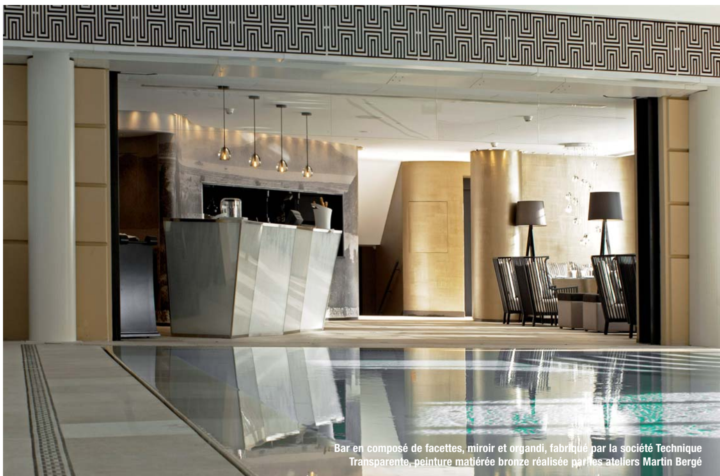
Bar en composé de facettes, miroir et organdi, fabriqué par la société Technique Transparente, peinture matiérée bronze réalisée par les ateliers Martin Bergé

V aste projet architectural, le programme portait sur la création d'une nouvelle piscine, de spa, de fumeurs, de bars et de restaurants du chef étoilé Joël Robuchon ainsi que de salles de réunions, de terrasses et de jardins extérieurs comme intérieurs.